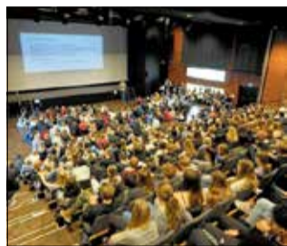
Galaksen har fået bevilling til at udskifte de nedslidte stole forrest i salen samt udskiftning af sceneelevatoren. Arkivfoto

Slotsgade 1, 3400 Hillerød Tlf. 48 24 41 00. Telefax redaktion: 48 22 89 21 www.sn.dk/furesoe furesoe@sn.dk Områderedaktør Janne Mulvad (mulvad) Journalist Mikkel Kjølby (mikkel) Salg og abonnement: hillerod.salg@sn.dk 48 24 41 00, dagligt 8.30-16.